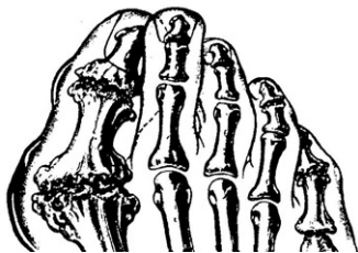
Pied avec arthrose

Pour que les mouvements des articulations se fassent tout en douceur, les os sont recouverts d'une couche de cartilage (tissu élastique logé entre les articulations) à ces endroits. Quand nous sommes jeunes, ce cartilage est uniforme, souple et doux et sert parfois d'amortisseur. Comme l'articulation contient aussi un liquide qui lubrifie (appelé liquide synovial), les os glissent bien les uns sur les autres. Malheureusement, suite à des traumatismes, au vieillissement et à l'hérédité, il se forme des crevasses de plus en plus profondes dans le cartilage,